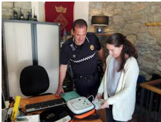
Entrega del nou Desfibril·lador de dotació del vehicle

Si aconseguït d'una forma diferent a la prevista.